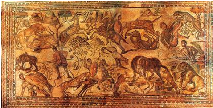
Figura 3: Oecus . Escena de caza

De acuerdo con Cortés (2008), en la sala principal de la vivienda (V-14 del plano) se sitúa el mosaico figurado más importante de la villa, el oecus . Las escenas centrales están rodeadas por una amplia cenefa en la que se superponen coronas de laurel entrelazadas. La parte figurativa del mosaico se puede diferenciar por sus dos motivos principales. La escena más cercana a la entrada se compone por la suma de varias escenas de caza independientes donde se representa la lucha entre varios cazadores con diversos animales, en su mayoría de procedencia africana. Los cazadores van tanto a pie como a caballo y utilizan jabalinas y lanzas para atacar a los animales.