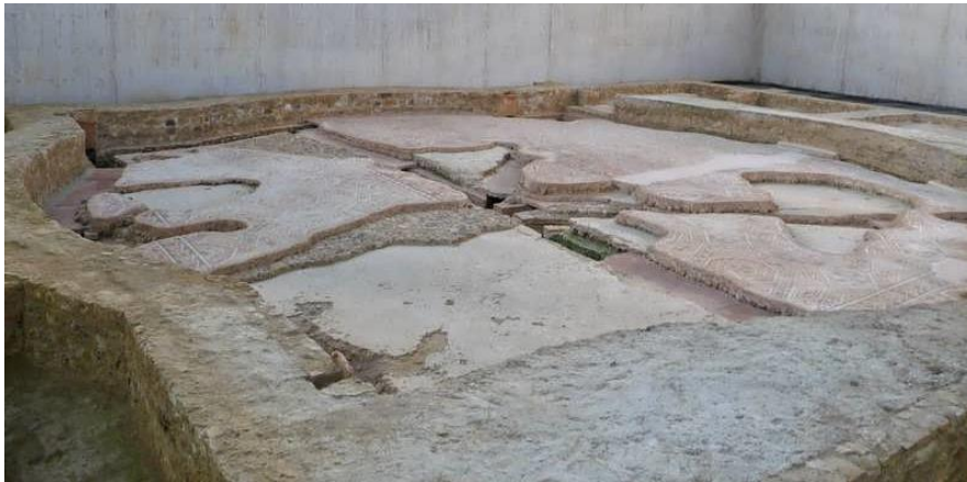
Figura 5: Baños. Sala B-12

En el sector sur nos encontramos con una sala central (B-12) de planta circular que recibía la calefacción mediante canales radiales y chimeneas, dando a pensar que podría haber sido una habitación templada. Encontramos cuatro salas pequeñas anexas de planta rectangular mediante dos puertas, probablemente salas de masaje destinadas a hombres y mujeres por separado (dos y dos).