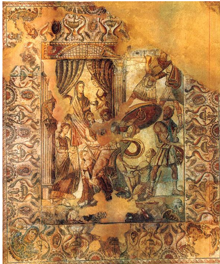
Figura 4: Oecus . Escena central y cenefa de medallones

donde se representan los rostros de hombres y mujeres, alternativamente. En las cuatro esquinas de la cenefa de laureles se encuentran representadas las cuatro estaciones en rostros de mujer, primavera y otoño parcialmente conservadas, verano desaparecida e invierno la más completa.