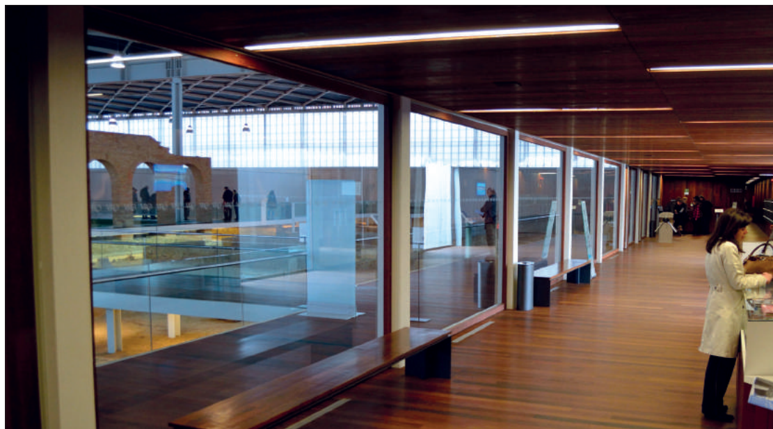
Fig. 6. Vista de la zona de servicios con la villa al fondo.

aplicación de una museografía que no complete ni reconstruya, sino que incite al espectador a completarla de manera conceptual.