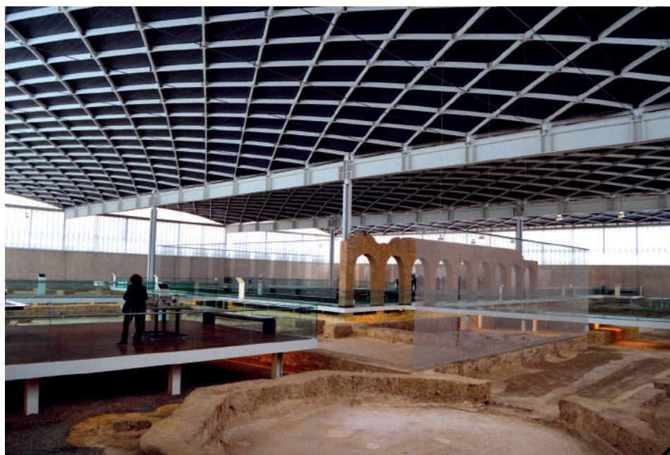
Fig. 5. Vista interior de la cubierta de la villa. Foto: Nailos.

matérico y formal es completamente abstracto, de manera que no interrumpe la visión de los restos. Además, su presencia se minimiza al apoyar sobre un cuerpo de ventanas que subrayan la gracilidad de su estructura. Este gran ventanal corrido, que al exterior se corresponde con el cuerpo de acero corten, se cierra con uralita, permitiendo la entrada de luz natural en todo el interior, además de mantener el contacto visual y ambiental con el entorno. La fuente de luz natural, con una dirección lateral alta, se completa con focos de luz artificial dispuestos a lo largo de toda la cubierta.