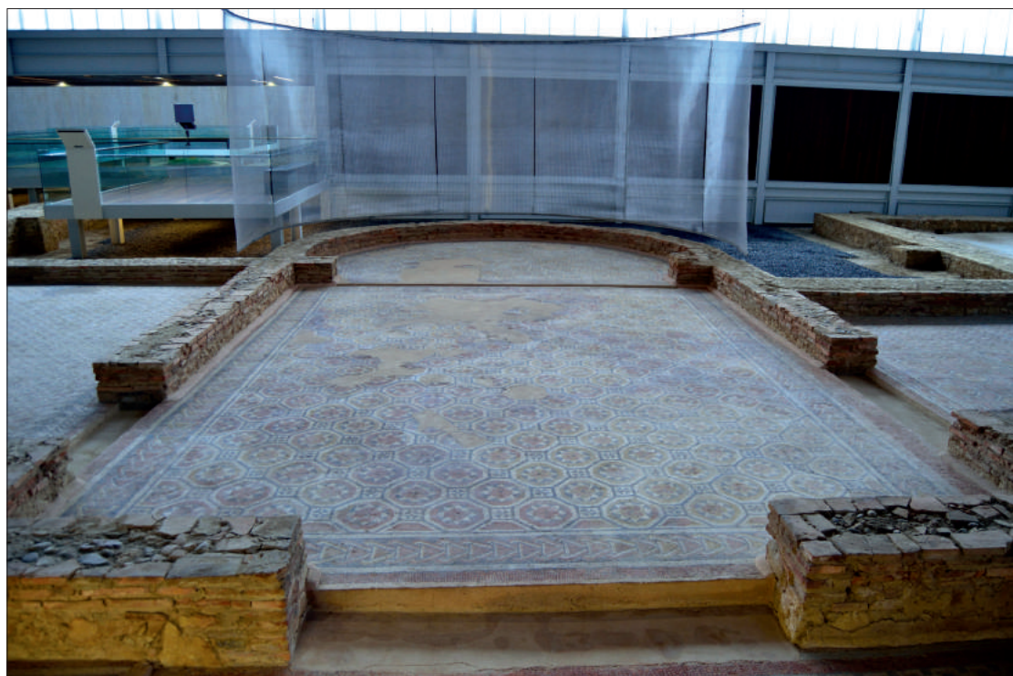
Fig. 2. Vista de uno de los remates en exedra.

con mosaicos. Mientras, el resto de las habitaciones estaban pavimentadas con opus signinum y seguramente estaban destinadas a un uso privado y cotidiano. En la parte norte, destacan sobre el conjunto dos salas rematadas con exedras, así como el hallazgo del hipocausto en una de las estancias del lado este (Figura 2). La simetría que caracteriza esta zona se pierde completamente en el lado sur, cuyas habitaciones no debían ser residenciales a juzgar por los objetos hallados en ellas. Los huecos en el suelo de algunas estancias, por ejemplo, se han vinculado con su empleo para la fabricación de vino; en otros casos, los restos de ánforas denotan su posible uso como almacén.