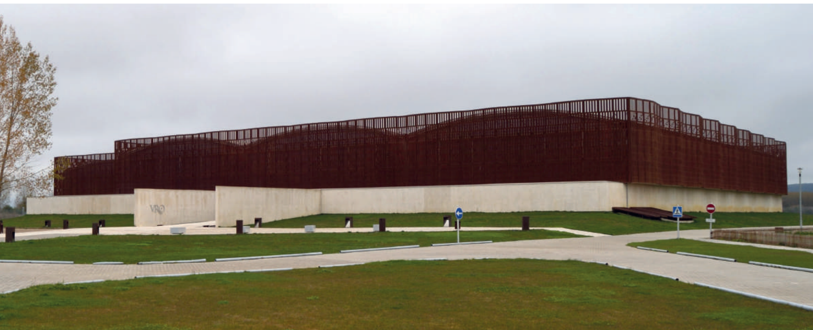
Fig. 4. Exterior del cerramiento de La Olmeda.

Con todo, el exterior es el resultado de la persecución por parte de los arquitectos de uno de los objetivos comunes a todos sus proyectos: la adecuación de las obras al entorno en el que se desenvuelven. Este intento de conciliación entre arquitectura y naturaleza no supone, sin embargo, una mimesis literal, más bien un acercamiento al paisaje a través de un lenguaje arquitectónico contemporáneo y de la elección de los materiales más adecuados al entorno (Paredes y Pedrosa 2004:54-60) 7 . La arquitectura se proyecta, por tanto, hacia un territorio que no sólo incluye el paisaje sino que integra una tradición, una función específica y unos contenidos particulares que han condicionado el proyecto.